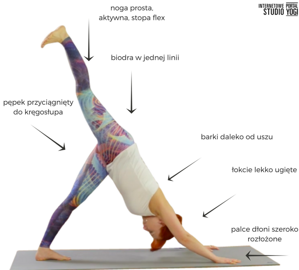
URDHVA EKAPADA ADHO MUKHA ŚVANASANA PIES Z GŁOWĄ W DÓŁ Z JEDNĄ NOGĄ W GÓRZE